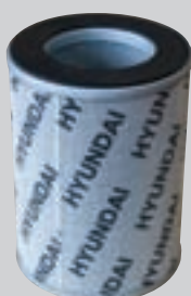
Filtro olio idraulico (1000 ore)

L'accesso da terra a filtri, raccordi di lubrificazione, fusibili, scarichi e componenti elettronici, unitamente ai vani ad ampia apertura, facilitano ai meccanici la manutenzione della serie 9.