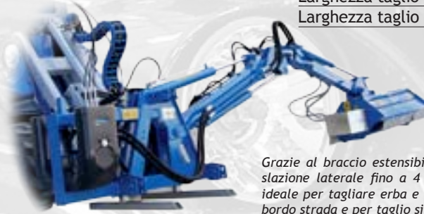
Trincia erba laterale

Versatile, leggero, compatto, il trincia erba è particolarmente adatto alla trinciatura di erba, sarmenti e rovi, in parchi, giardini.