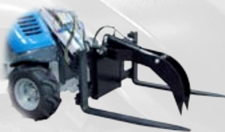
Pinza idraulica per forca pallet

E' ideale per sollevare e movimentare diversi tipi di materiale su pallet.