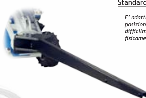
Asta di sollevamento