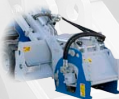
Fresa per asfalto

Braccio escavatore compatto, studiato per piccoli scavi, ma efficiente allo stesso tempo. E' un accessorio professionale adatto per piccole e medie macchine Multione.