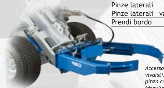
Pinza per vasi

E' adatta per sollevare e posizionare oggetti in luoghi difficilmente raggiungibili fisicamente o con altri mezzi.