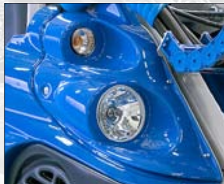
Kit fanali stradali