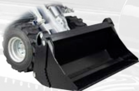
Benna multiuso 4 in 1

Utile per la raccolta di materiale leggero e voluminoso, il trasporto e lo stoccaggio di merce. Uno speciale supporto rende il cassone stabile finché la macchina rimane ferma. Il cassone si svuota dal posto di guida.