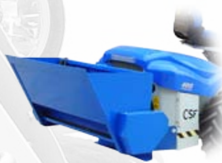
Spandisale / spargisabbia

Garantisce un'efficiente rimozione della neve sia asciutta che bagnata. Rotazione camino di 200° azionabile manualmente o elettricamente.