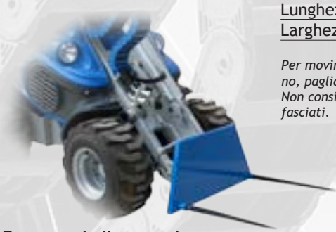
Forca per balle rotonde