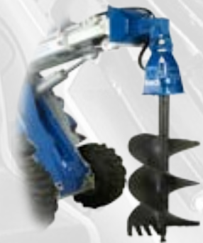
Trivella per piante

Per il sollevamento di materiale, grazie all'estensione del braccio telescopico a movimento idraulico, si può operare in luoghi poco accessibili o in presenza di ostacoli e barriere. Gancio omologato.