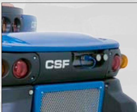
Kit prese posteriori