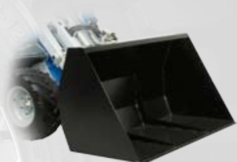
Benna grande volume

Equipaggiata con lama oscillate, la lama spartineve è l'accessorio ideale per rimuovere la neve dalle strade, piazzali e recinti privati.