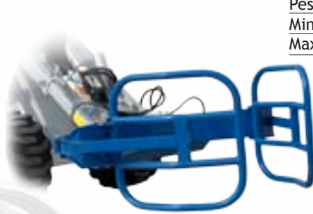
Pinza per balle rotonde

Per movimentare balloni di fieno, paglia e altri tipi di balle. Non consigliata per balloni fasciati.