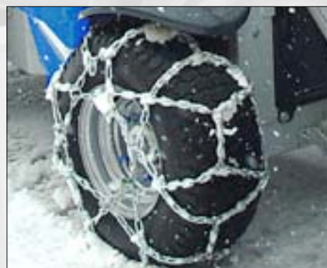
Catene da neve