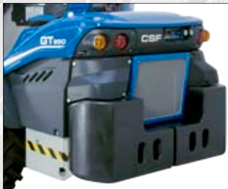
Coppia zavorre posteriori 484 Kg