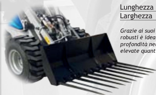
Forca a denti lunghi

Pinza con due mordenti superiori ad azionamento idraulico e denti intercambiabili. Ideale per lavori pesanti in agricoltura.