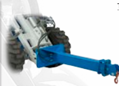
Asta di sollevamento telescopica

Accessorio ideale per vivaisti. Apertura pinza comandata idraulicamente, regolazione della forza di chiusura.