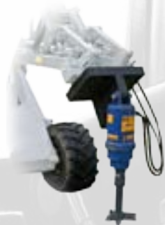
Trivella per ceppi