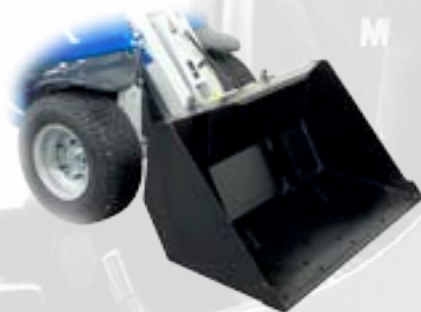
Benna per sabbia con lama