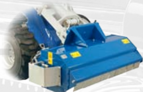
Trincia erba frontale

Posizione di lavoro verticale. E' dotato di cilindro idraulico che spinge il tronco attraverso le lame, con una forza idraulica pari a 7 tonnellate. Altezza di taglio e corsa coltelli regolabili.