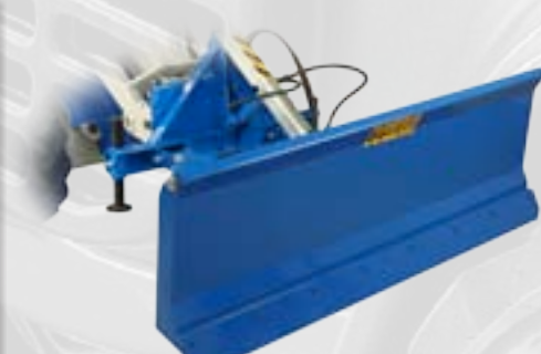
Lama da neve