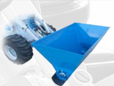
Distributore di mangime

Per irrigare aree verdi e piccoli terreni, grazie ad una barra di larghezza molto estesa. La capacità del serbatoio consente una buona autonomia di lavoro.