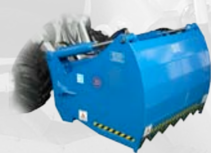
Benna trancia insilato

E' una benna che si carica autonomamente. Equipaggiata con motore idraulico e con una coclea all'interno per la distribuzione del mangime per animali. Scarico mangime sul lato destro.