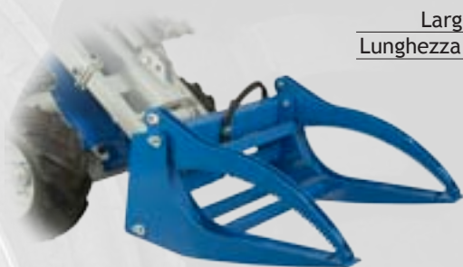
Pinza per tronchi

Accessorio per tagliare l'erba. Ha una barra frontale con due file di coltelli ad azionamento idraulico.