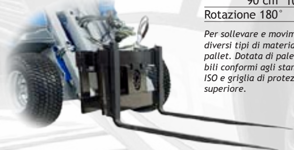
Forca pallet con rotazione

Accessorio ideale per apicoltura, ma utile anche in magazzino per la movimentazione di cartoni e imballi vari.