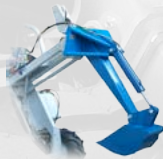
Braccio mini escavatore

Per stendere asfalto, ghiaia, sabbia, procedendo in retromarcia. E' ideale per lavori di ripresa e manutenzione su strade, marciapiedi, parcheggi. L'apertura è guidata idraulicamente. Regolabile in altezza da 0 a 10 cm, con piedini.