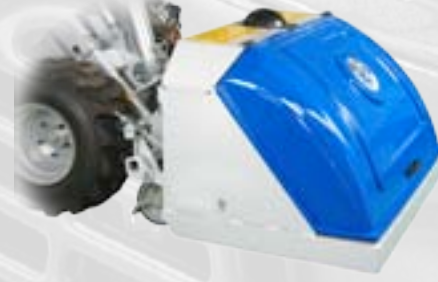
Tornado, rasaerba con raccolta

Per giardini, parchi e campi da golf, la robusta costruzione rende il rasaerba affidabile, versatile e garantisce una lunga durata di servizio.