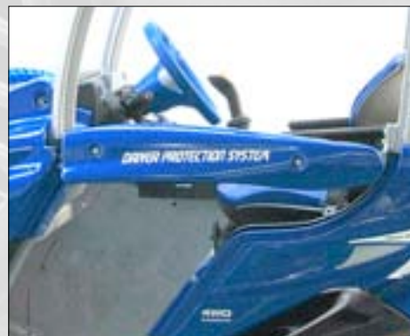
Barra laterale di sicurezza operatore