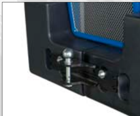
Kit gancio traino