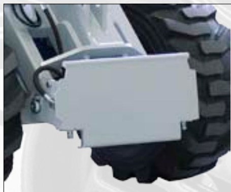
Piastra aggancio utensili idraulica